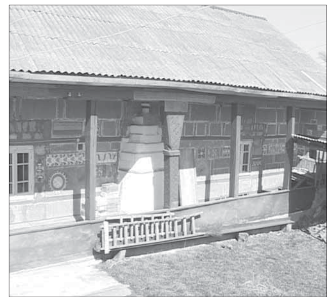
Кюрягь гьулан мист

Гьит Аллагьди ﷺ ухьуз варидариз тавфикьвал туври! Амин.