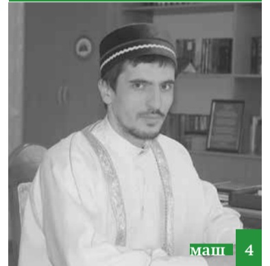
Мавлид фу ву?