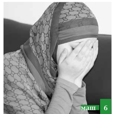
ФатІмайинна Аьйшайин насигъят