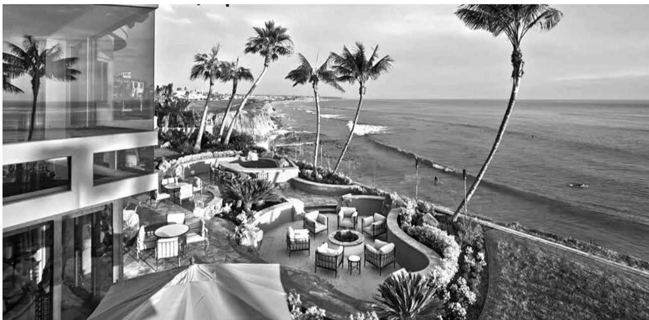
Ихъ уьмур чан утканваларихъди, леззетарихъди кучӀлин уьмур ву, ва увура дидихъди гъушиш, кучӀликк ккахъдива

хир гъубхъган, ухъу гъадмукъан такабур шулхъаки, улупури, магъа, узуря жилир вуза кӀуруганси. Арагъ убхъбийнби жилир шлуб вуйинхъа? Эгер дурари ав кӀуруш, ухъуз рябкъюрахъузки гъамус фици саспи дишагълийира арагъ убхъуруш. Хъа дихъидинхъа ухъуз гъацир жилир, ахиратдигъра уву уьрхъюз шлур, ясана чав уьрхъюз шлур? Ваъ!