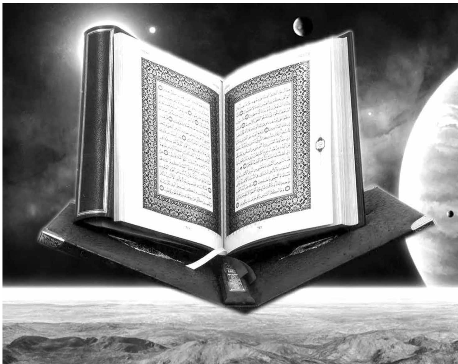
Фуну касди Къур'ан чаз ккуниганси тафсир гъапѳиш, яники мяна туввиш, гъит думу касди чаз жегъеннемидиъ йишв ккабалгри

Къур'ан нивкѳ алабхъурайи вахтари урхуз хай шулдар, гъаз гъапиш урхури чазра аьгъдарди душвахъ гъалатѳ апѳуз мумкин ву. Эдеблу ляхнарикан гъисаб шулу Къур'ан урхруган дикъатвалиинди хъпехъуб. Къур'андин аят къюбпшубубпи ражари ебхъурашра, гъадму аятдихъ сабпи ражари ебхъурайибси хъбехъуб эдебнан ляхнарикан, суннатарижан ву. Къур'ан урхурайи касдиз экбер апѳури гъебхъиш, ясана сар шликѳа дугъаз салам туввиш, дугъу урхивал аят ккудубкѳру йишвахъ дебкѳру ва экбрис, ясана салам тувуриз жаваб тувру. Хъасин чан убхурайи йишвахъанмина, уху улихъ дупнайиганси, «ауъзу» ва «бисми» дупну, давам апѳуру.