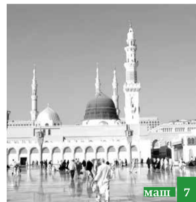
Мугъяммад пайгъамбар бабкан гъахъи ваз