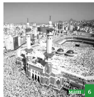
Вари аьламдиз нумуна кас