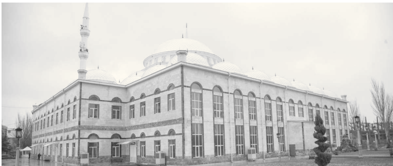
Мягъячгъала шагърин клулин мист