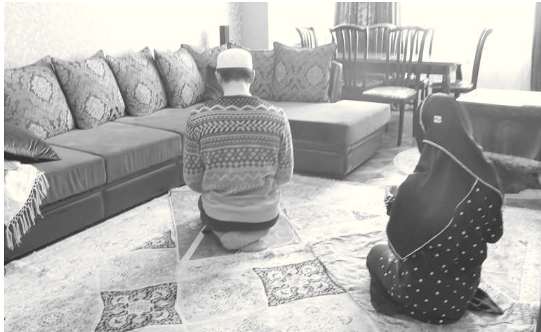
Аллагу Тааълайихъан гучІ апІинай ва жвуван диндин тереф за апІинай

3. Ухъу чакан улхурайи кас, жвуву жвуз гъацир харжир вуди, халкъ гъапІнийинхъа?