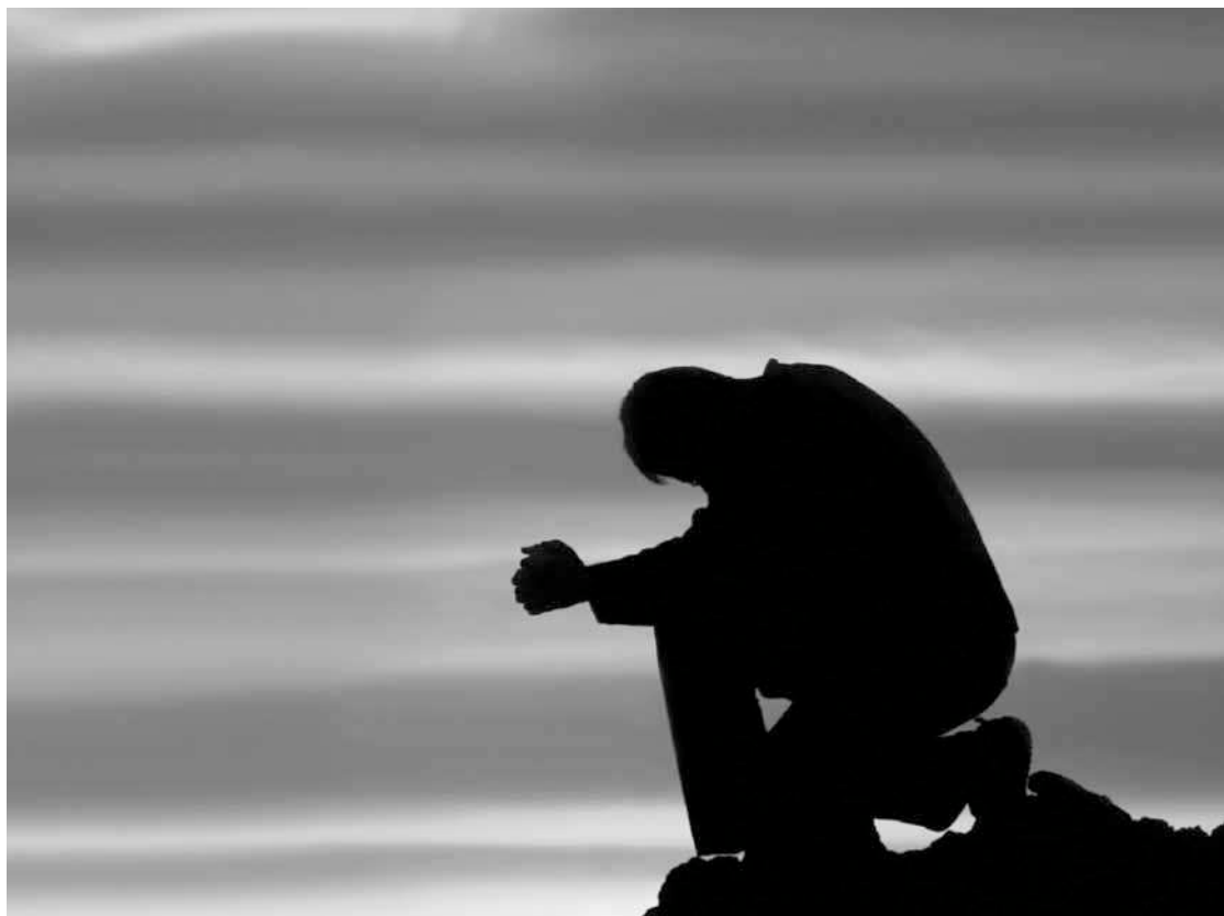
Бунагь баврия пашман хьуну тавба дурма – бувагу бунагь къабувма кунассар