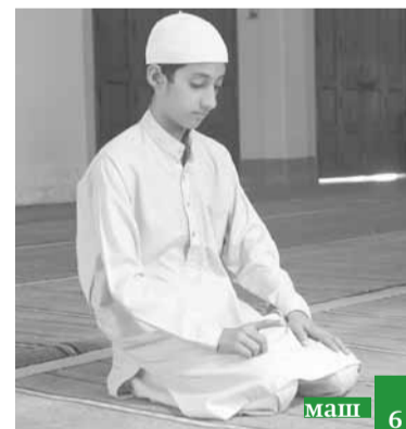
Мусурман дарударин накъ-вар