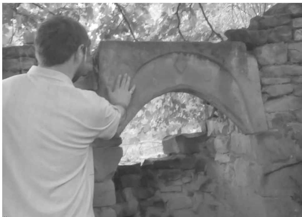
Йирси мистан цалар

саб гъулак мисал ву пузра шулу. Мурарин жямаятлугъдин арайиъ шлу ляхнар-капар, хайир-шеирар вари