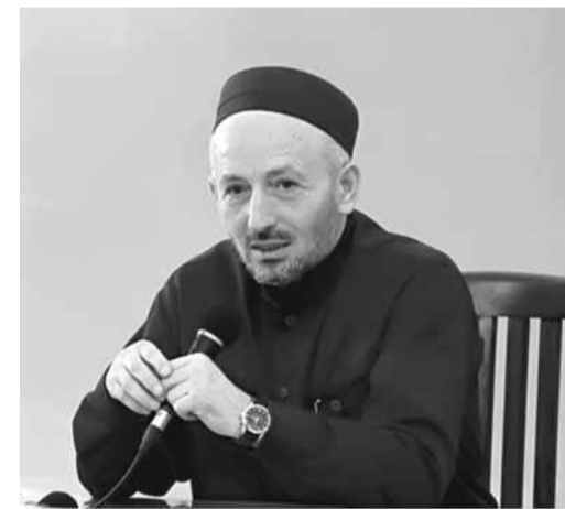
РД-ЙИН МУФТИЯТДИН ПРЕДСЕДАТЕЛЬ ШЕЙХ АБГЪМАД-ГЪАЖИ АБДУЛАЕВ

мазандин вазли гъарсабдикан аьгъю Аллагъди ﷻ Гирами Къур'ан жилиинна дахил гъаплну, думу вазли гунгъарин аьфв аплуру, гизаф ражари ва артухъ къадарнаьди ужудар ляхнар из савабар тувру. Гъаддиз, гъюрматлу гъардшар ва чйир, деету гунгъарин швумалвал зигуз ва сари тмунуригъ чпи деету гъалатIарин бахишламиш аплувал ккун аплуз гъялак йихъай. Гъарсабдикан аьгъю Аллагъдиз ﷻ икрам аплувал цIйи алаплури, гизаф къадарнаьди ужудар ляхнар аплинай, гунгъарихъан марцц хъуз чалишмиш йихъай ва ичв юкIвар ужудар фикрарихъди тухъ аплинай. Гъит Аллагъди ﷻ ихъ аьхю Ватан гъарган ислягъвалигъ гъибтри.