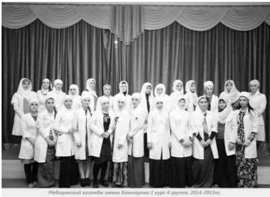
Медицинский колледж имени Башларова I курс 4 группа, 2014-2015гг.

Свою деятельность Медицинский колледж им. Башларова начал в 2011 году. Сегодня Медицинский колледж