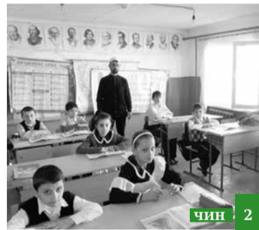
Къурагъ райондин имамди аялриз Исламдикай ахъайна