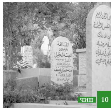
Исламдин эдебиятдин багълара