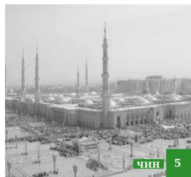
Ражаб – Аллагъдин ﷻ варз