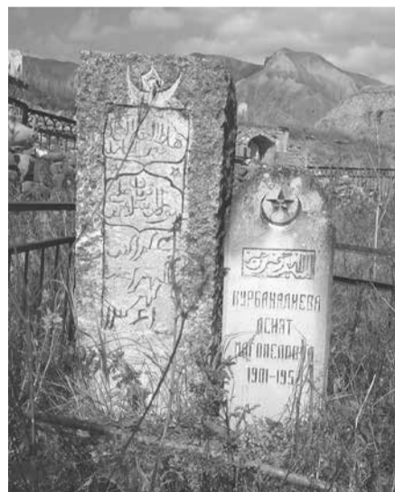
Нурул-Исламлул ва мунал кулпатрал гъаврду

бутлуву жулва оьрмулувусса багъу-бизу бачин баврия бувсуну бур. Масалларан: дуки-хлация дуккаврия, янна лаххаврия, ниттибуттал ва оьрчал дянивсса арарду, лас-шарнил дянивсса арарду, бивклу-букку буччаву, магъар бившаву ва м.ц.