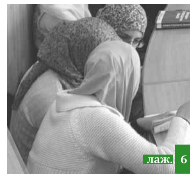
Буржирдава уккайсса куц