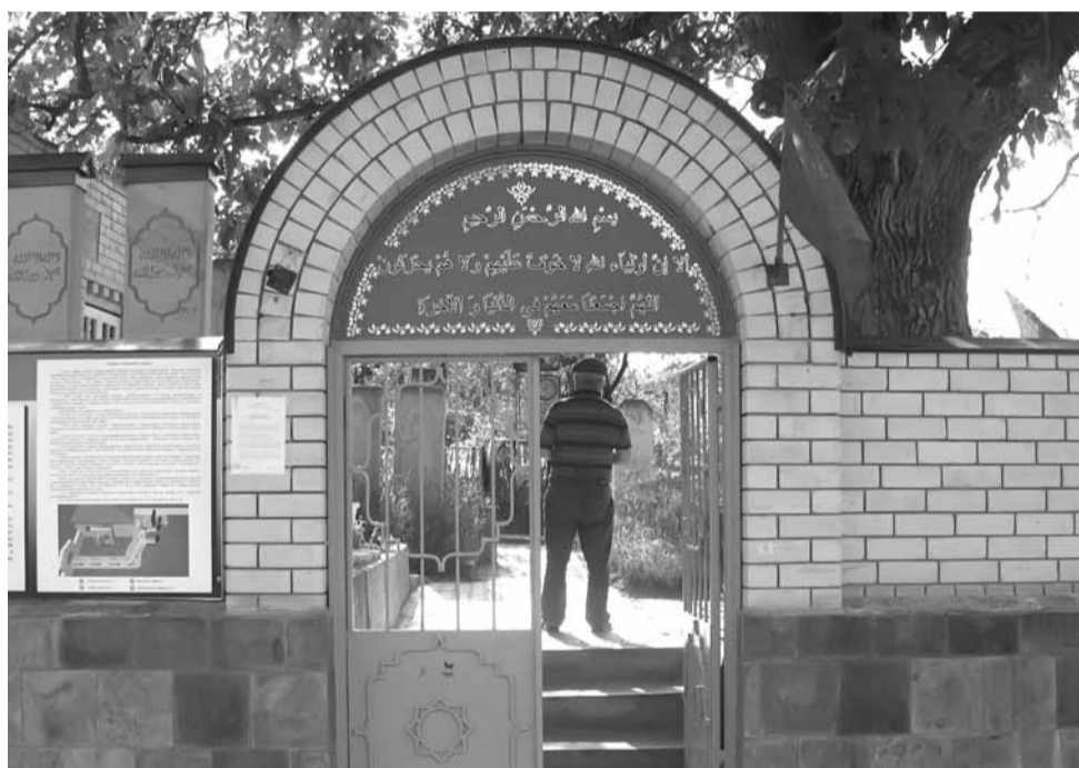
Ялувмур Къазанищливисса мукъа устазнал зиярат бусса хІатталу