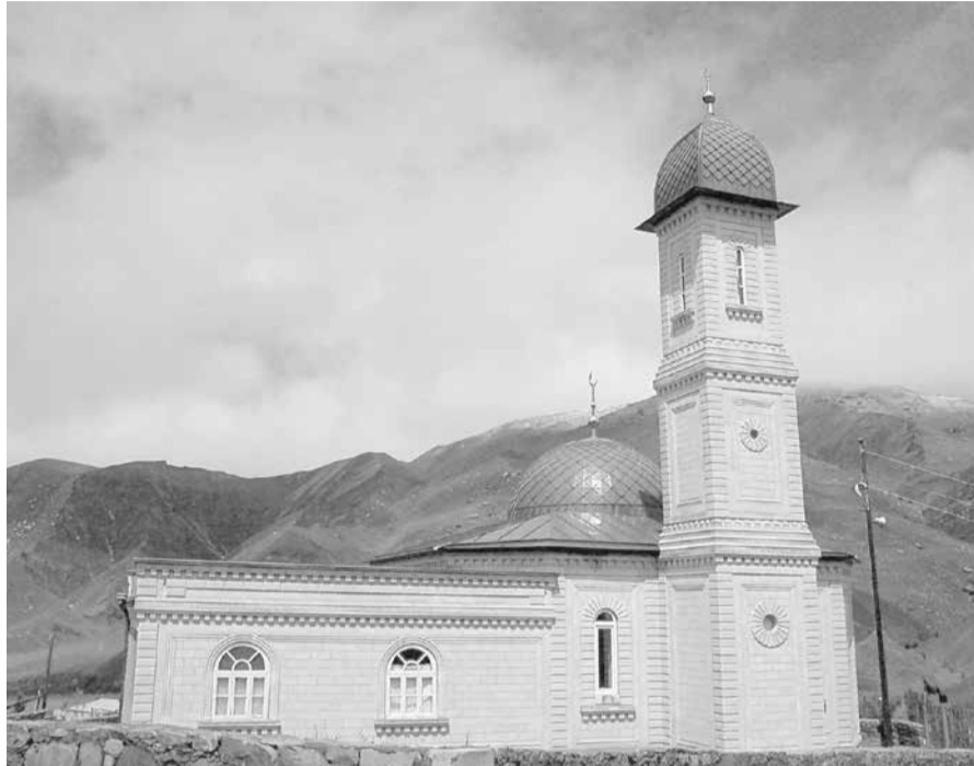
Ваччиял шярвусса мизит

Ваччиял шярваллин дур 1500 шин ххинугу. Шярвалу дур Дагъустаннал дяниву, лахъсса зунттаву, анаварсса неххал чларав, оърчисса, ранг-рангсса цлуну дурсса къатрал дянив. Лахъния бурувгукун, члалай бур щюллисса магъи дусса кляла чарил мизит. Му бур мяъдан, оърчи чартал дянив, багълул ххирасса яшмилул ляълу дирхъний кунма члалай. Ялувчиннийсса шярваллил махлардугу бур, ляълурду даргъуну ца-кляра личланнин, ца члумал багълул ххирасса паччахьнал арцул таж кунма члалай.