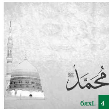
Нушани ху чехлеваире, амма ху нушаб дигахъуре