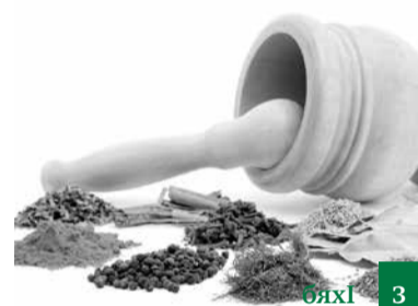
Къуръан – лерил излумас дарман