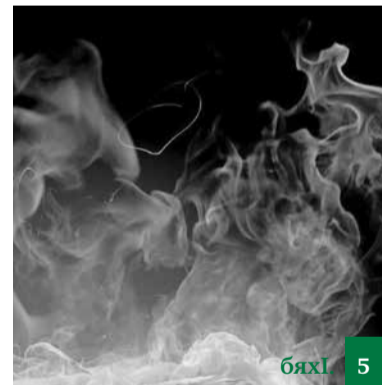
Сунечивад жаваб бедес хейрусини нушачивад бедлугара?