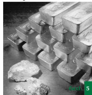
Давла – заманалис бузахъес гибси мас саби, муртлисалра кавлуси ахлен