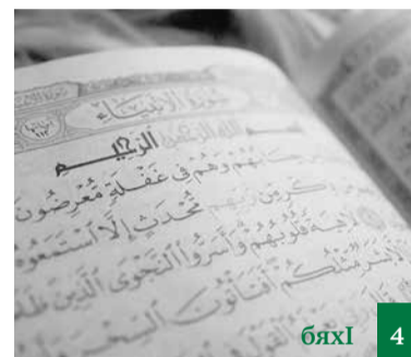
Вецлал гъяхлти гъямал дарибсилличи цугбиркуси ца хлярп