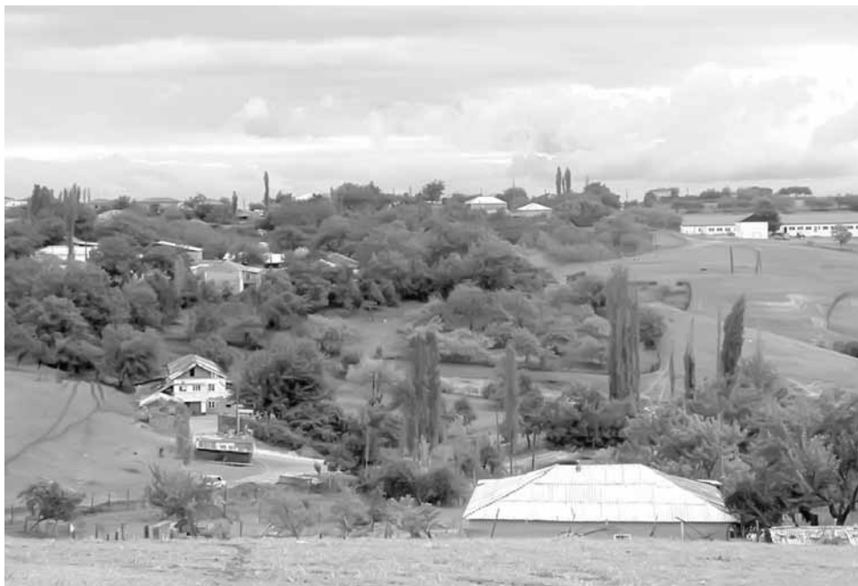
Табасаран райондин Бургъанкент гъул

Девлет-мулкар колхоздиз бахиш апІбан къяляхъ, думу гъадушваъ вафалуди лихури гъахъну. 1949-пи йисаз Шариабтдин къанунар кІулиз гъахури, гъулан жямьябтдин улихъ шулу. Дявдин къяляхъ гаш йисари гумихъ ихтилат-насигъят туври, дугъу жямьябтдиз чаз чан устазарикан гъеебхъу ихтилат ктибтуру: Саб ражари Иса пайгъамбар чан юлдишхъди дяъват гъабхуз гъягъюраридар, чпин гаш'вал ккетІябхъюз,