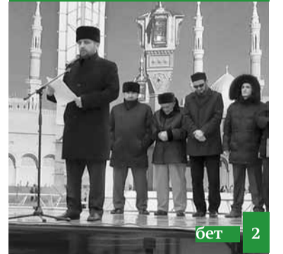
Пайхаммарны межити Дагъыстанда