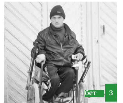
Ругъу къатгы адам