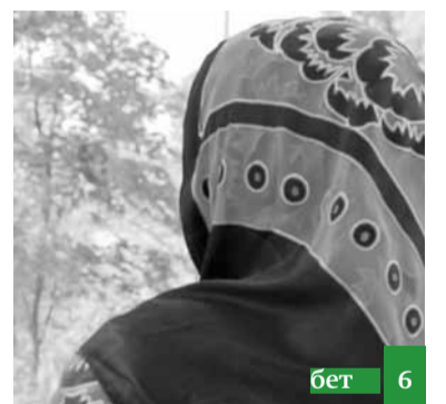
Мен гъижапны нечик сююп къалдым