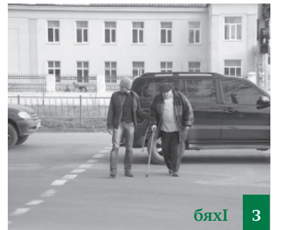
Чузивадди Аллагъ урузкули Сай