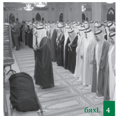
Перкъаси сафарличи хладурдеш