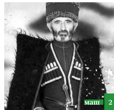
Шейх Аъли-гъяжи Афанди ихъ арайиан гъушну