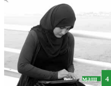
Инсанариз афв апІинай - азарлу хъидарчва