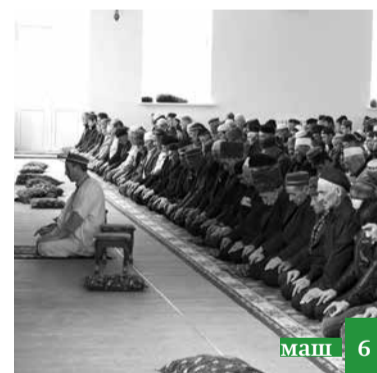
Жъмяагъ гъудгникан жикъиди