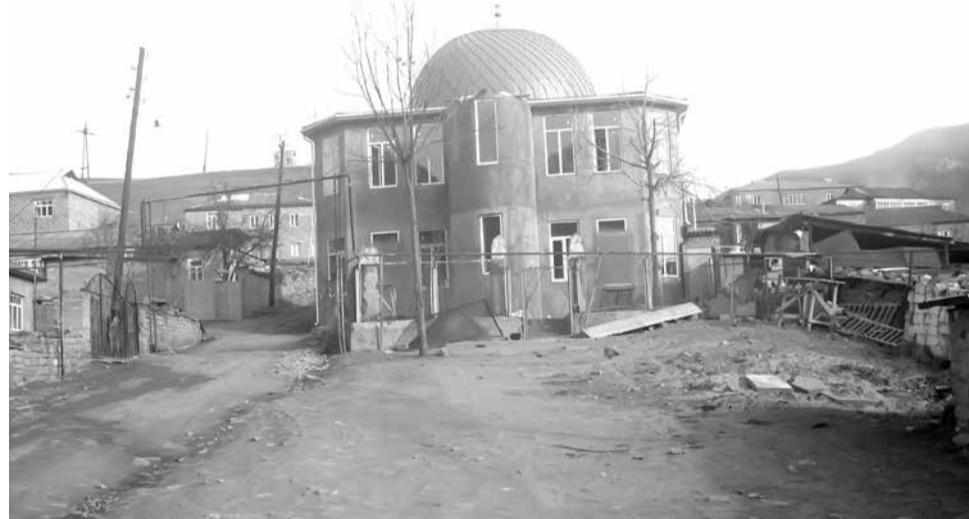
Хив ғыулан мист