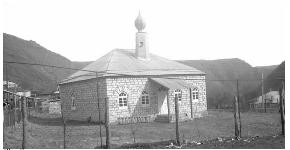
Ции Хирижв ғыулан мист