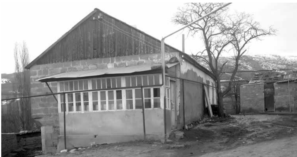
Цудухъ ғыулан мист

Ґыабиклур Абдул Мутгалиб-ғыажи Ґыазрати Аьлиев ву