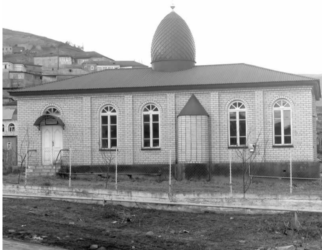
Чюевекк гъулан мист