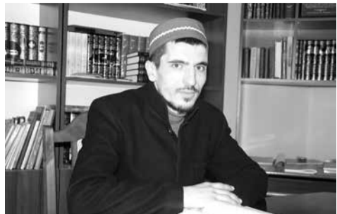
Амир Мевлютов Огни шагърин медресейин мялим

ИБАДАТВАЛАРИКАН ВА ДУРАРИН ФАЗИЛАТВАЛАРИКАН