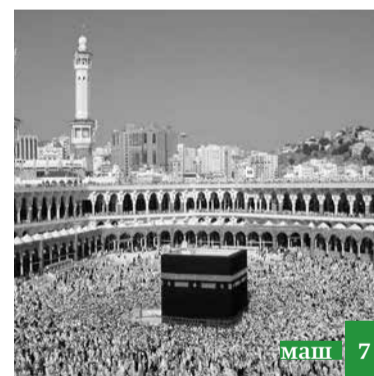
Мусурман, жилир ва игит