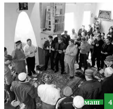
Гъачай фарзарикан агъгъю ап'ухъа