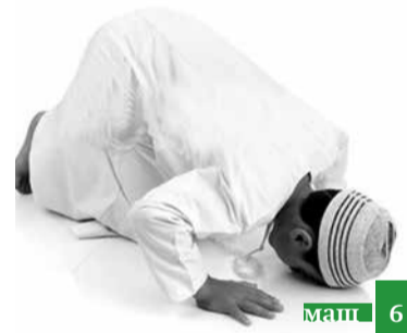
Шаклу дюшюшариъ ап'ру суннат-гъудган