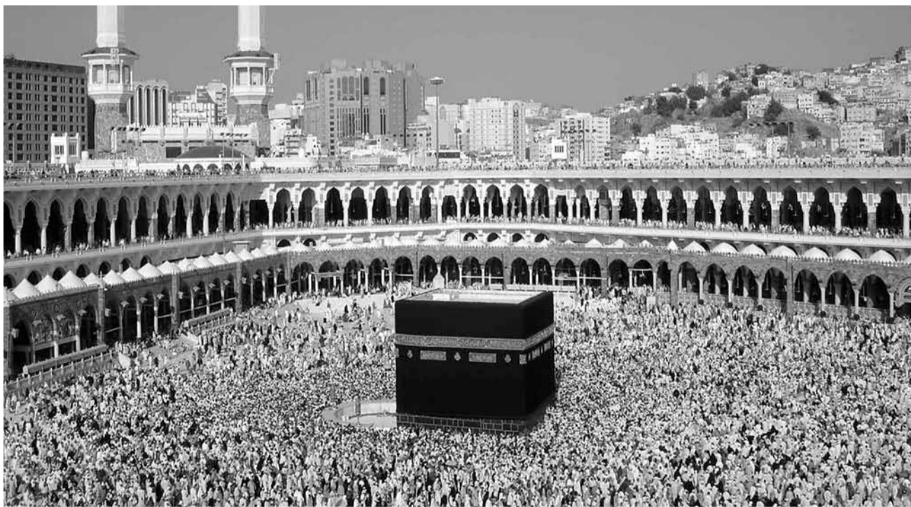
Ихъ абйири ухъуз гьибту Ислам дин масу мутуванайчIва инсанар!

игитар, чпин ад ва чибкан улхуб гьийин йигъазра ккудубкIну адрудар?! Наши думу ухъухъна дин хъади гьафи, ва Аллагъдин ﷻ рякьюъ чпин жанар туву асгъябар?! Хъа гьийин йигъан ихъ гьиллигъар фициб гьялназ дуфна? Ухъу ихъ багъалу дин ва дагълуйин намус фициб дережейиз кидипна? Ихъ заманайи му дин, ихъ абйирин ва Пайгъамбарин ﷺ ирс масу туврадаринхъа? Ва думу ихъ варитIан аьхю душмниз, шейтIан льянатуллайиз, ухъу жегъеннедин цIиз гьахуз ккунибдиз, гьацдар Ислам дин тIанкъ апIуб мурад-метлеб вуйи къяфирариз масу туврадаринхъа?! Гьяйиф, ихъ арайиъ гьаму дюн'яйин чIюрхяр бадали, саб