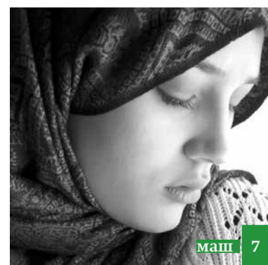
Дишагълийирин гъякъар Исламди уьрхюра