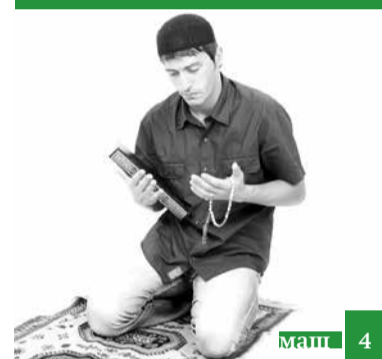
Гъачай фарзарикан аьгъю аплухъа