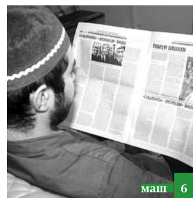
Аьлим кас му дюн'яийин Аллагъу Тааьлайин вакил ву