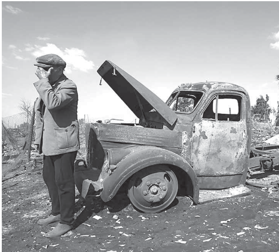
ДухIан багъсса захIматшивруттал бусурманчув бунагъирттая марци увайссар.

Яла вама малаикнал цIувххуну бур: «Ина чун най ура?» – куну. «Нагу ура вилмунияргу махIатталсса буюр биттур бан най», – куну бур ванал, – «Ца шагърулий мува куцуй бивкIуллул шаний ур бусурмансса адимина, мунангу ччан бивкIун бур накI хIачIан. Мунал бувсса циняв бунагъру Аллагънал ﷻ шювшунни баларду, захIматшивуртту, цIуцIавурду гъан дуллай. Так ца бунагъ ливчIун бур ганал дарвачрай. Нагу най ура ганан дулунтIисса накIлил кIичIу шяв бувтун, накI экъи гъан дан, га бунагърахлуну кафаратну хъуншиврул», –