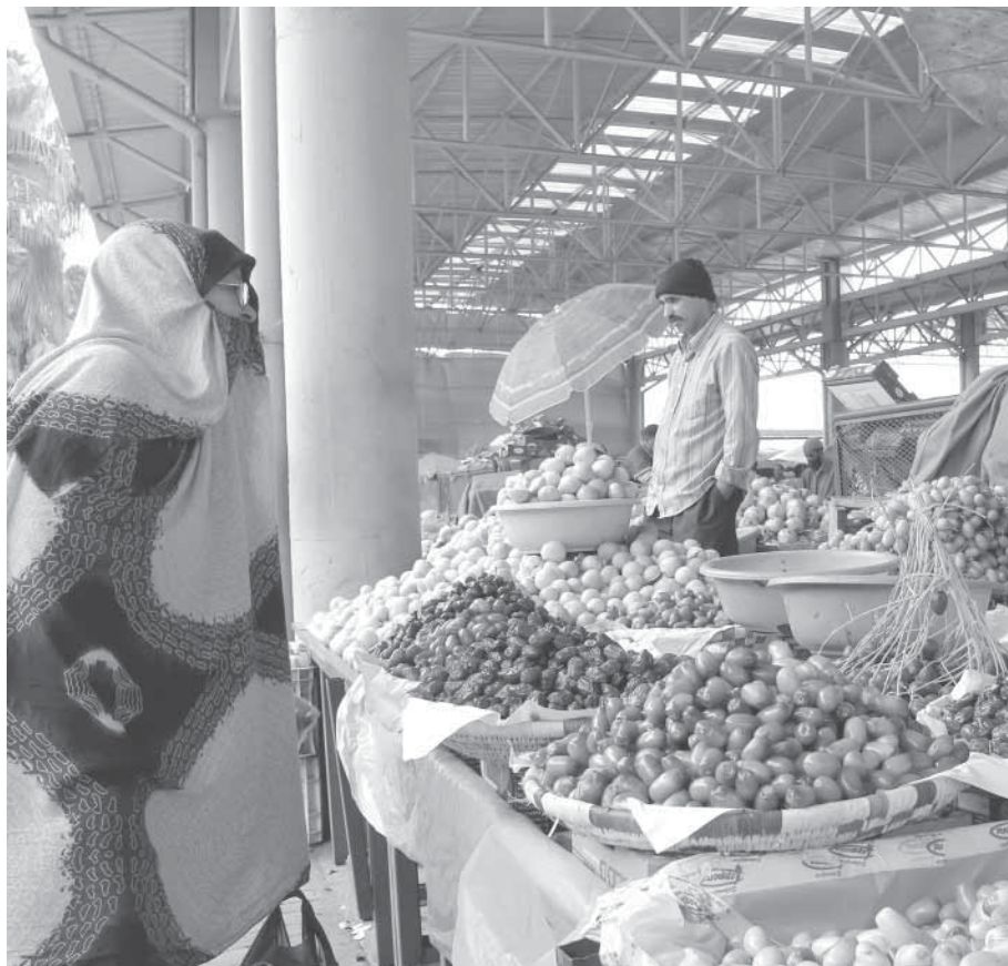
Хіалалну маэшат байма Аллагьнан ꞥ ххирассар

эбадат чанссар, тавба-дуаь кьамул кьадайссар. Хіатта цуксса чансса бухьурчагу хіарамсса лукьма инсаннал бувкуну льякьлуну багьувкун, мунаха ссавнил агьулданулгу, лухччинул агьулданулгу нааьна дайссар. Му льякьлуну буссакасса, мунал чакгу кьамул кьабайссар. Тавбагу кьадурну, мукуна уна ивчїарча дуржагьрал агьлунугу шайссар. Аллагь Тааьланал цана кьаччисса инсаннал хіарамсса хьус чїару дайссар. Хіарамсса хьуслил залуннал «я Раббий» куну Аллагь ꞥ кїицї лавгукун, Аллагьнал ꞥ учайссар «Ла лаббайк я аьсий» - куну. Хіарамсса хьус цанна куна ца-