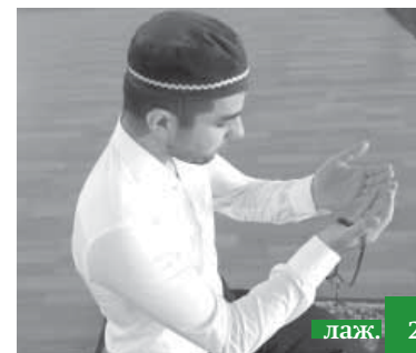
Дуаь къамул даврил сававру