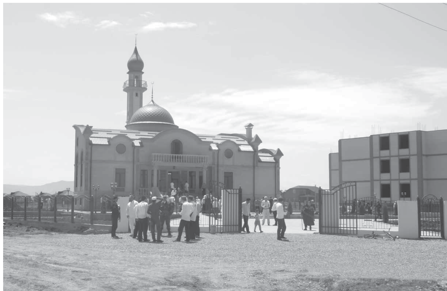
Шавваль зурул ххаришиву