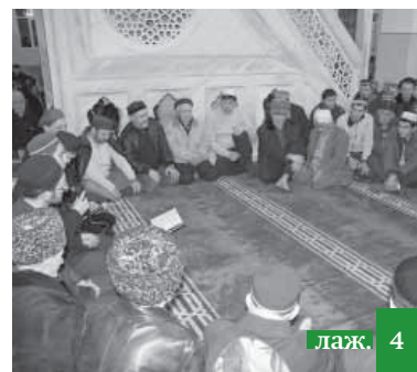
Мавлуд – умматрал ххаришиву