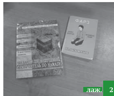
Лакку мазрайсса диск ва лу