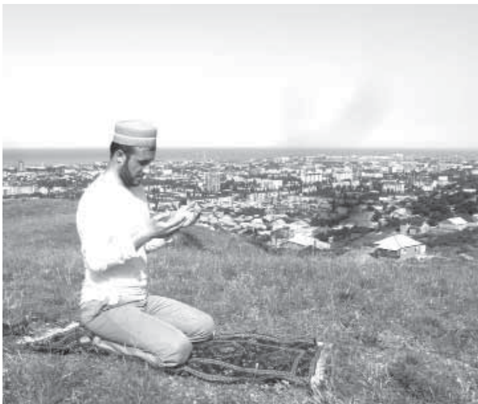
ушв гьидисиш, хъасин шаввалигъра - 6 ушв, сад йисан фарз ушвар гьидис-

Саб вазли ушвар дидисну машквран къяляхъ хъанара ушвар дисувалиъ фициб гьикмат а? Гьикматар гизаф а. Дурарикан саб, вазлин арайиъ ушвар гьидисдарин хурагнахъна ужуб иштагъвал ади шулу, ва му саягънаъ ушвар дисувал давам апуб нефсдиз читин ляхин ву. Гъаци вуйиган, Аллагъдиз ﷻ табигъ духъну, чан нефсдиз гьаршу гьахъиш, мидин саваб ахюбу шулу. Саб ваз Рамазандин ва 6 ушв Шаввалинра гьисаб гьапган 36 ушв шулу. Абу Аюб аль-Ансарийихъан вуйи гьядисдиъ дупна: «Шли ушвар гьидиснуш Рамазандин вазлиъ ва хъасин шавваль вазликанра 6 ушв гьидиснуш, думу касдиз вари йисан ушвар гьидисгансиб саваб шулу» (Муслим). Хъа эгер Рамазандикан ва Шавваликан дарди, жара вазаритъ 36 ушв гьидисиш, сад йисан гьидисгансиб саваб шулин? «Бужайрами» китабдиъ дибикина: эгер Рамазандин вазлиъ