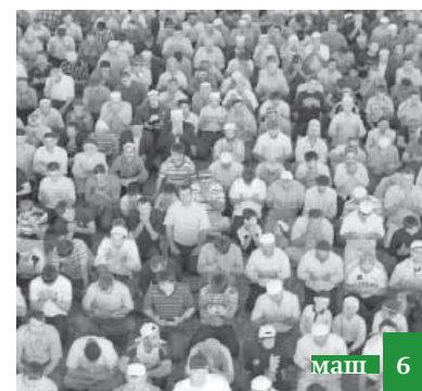
ДУМД-дин канонический отдели имамарикан ккун ап'ура!