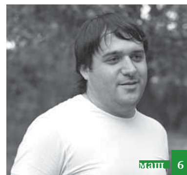
Уъмрин натижа – Аллагъдин разивалигъ