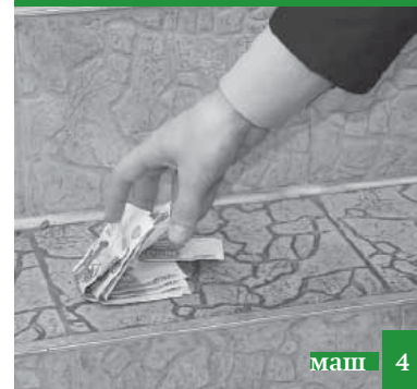
Гъибихъу шейгънакан фу дап'ну ккунду?