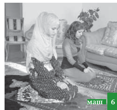
Аьлимарин уьмрин рякь