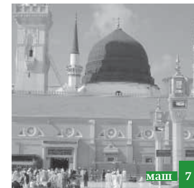
Дишагьлийири фикир тувну ккунди ляхнар