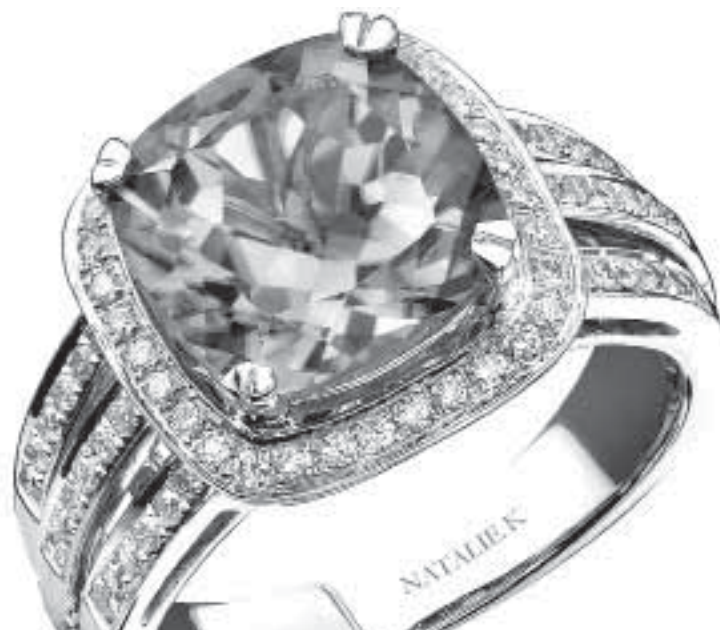
Дугъриданна Пайгъамбари ꞌ гъизилин тублан жилариз гъярам гъапну

Аъбдулла ибн Жяфарихъан гъядис дупна: «Дугъриданна, Пайгъамбари ꞌ тублан арччул хлихъ хъапри гъахъну». Анасди ктибну, Пайгъамбари ꞌ арсран тублан гъибисну ва дидик утубкури «Мугъяммадан расулаЛлагъ» гафар гъидикну (аль-Бухари ва Муслим).