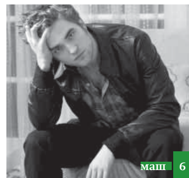
Туба ап'уз къан мап'ан!