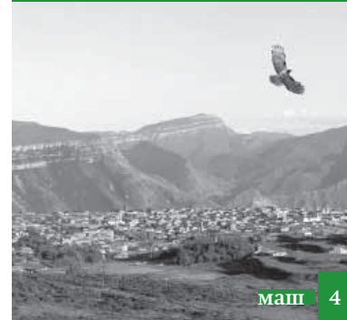
Алимдиз гъюрмат ап'ин, гъубзуз увухъ берекет