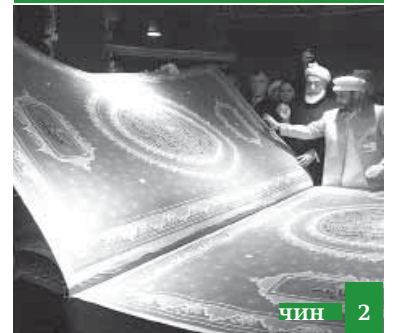
Виридалайни еке Къуръан гила Афгъанистанда ава