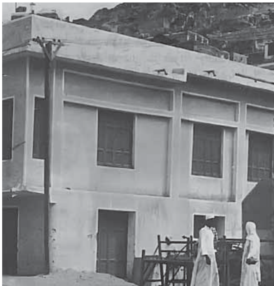
Меккада авай Пайгьамбардин ﷺ папан Хадиджадин ﷺ квал.

эвер гуз башламишна. Меккадин жемьт кватл хьайила, Аллагьдин Расулди ﷺ лагьана: «Квез за таб авуна гьич садра кьванни акурди яни?» Жемьтди жаваб гана: «Чаз вун гьамиша гьахь лугьузвай инсан тирди чизва». Пайгьамбарди ﷺ дагьдал ишара авуна халкьдивай жузуна: «Эгер за квез атла дагьдин кьулухь Меккадал гужум авун патал душманрин кьушунар кватл хьанва лагьайтла, куьн зи чIалахь жедали?» Жемьтди вирида санал жаваб хана: «Эхь, вуна таб тийидайди чаз чизва». Пайгьамбардини ﷺ абуруз лагьана: «Гила яб це, заз Аллагь-Таалади Вич сад тирди квез малумарун эмирнава. Эгер куьн сад тир Аллагьдихь ﷺ инанмиш тахьайтла, куь кьилел еке бедбахтвал кьведа». И арада Пайгьамбардин ﷺ ими Абу Лагьаба кьал кьачуна, гьарай-эвер гуз эгечна ва Пайгьамбардиз ﷺ ихтилат кьилиз акьудай мумкинвал ганач. Гаф пай девлетлуьри Аллагьдихь ﷺ иман гьанач, анжах кесибрини луклари михьи дин кьабулзавай.