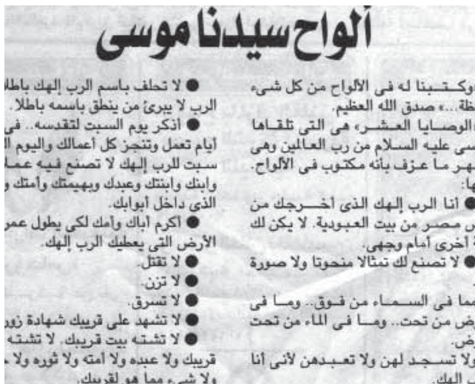
Муса пайгъамбардиз عليه السلام рактурнавай Кьулалар кьенвай бязи кьанунар.

ни абуроз авачир, гьатта абуркай сад кьванни вич яна рекъизвай инсандиз килигнайтла, адан туба кьабулзавачир. Гунагъ авурбур гьатта рагъ акидалди терг авуна, кьейибурун кьадар пудкьанни цуд агъзурдив агакьнавай. Вилерал нагъв алаз Гьарун عليه السلام ва Муса عليه السلام Аллагьдихъ عليه السلام элкьвена: «ИкI хьайитла чи халкь михъиз црада». Аллагь-Тааладини цифи квадарна ва яракьар кьерехдихъ авуна кьиникьар акъвазарун эмирна. Идалай кьулухъ Мусад عليه السلام чилел алай кьван мейитар акуна ва адаз пис хьана. Амма Аллагьдин عليه السلام патай вагъйу атайла, ам секин хьана. Адавай хабар кьунвай хьи, кьейибуру ва абур ни яна кьенатла гьабур Женнетдиз рактурналди вун рази яни? Абурун туба кьабулнавайди Кьурьан-