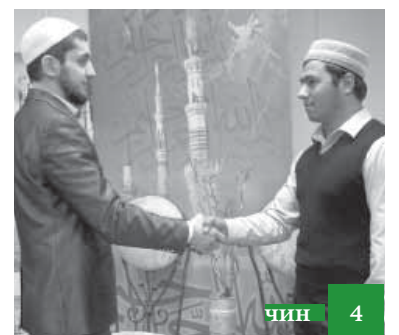
Салам гунихъ галаз алакъалу месэляяр