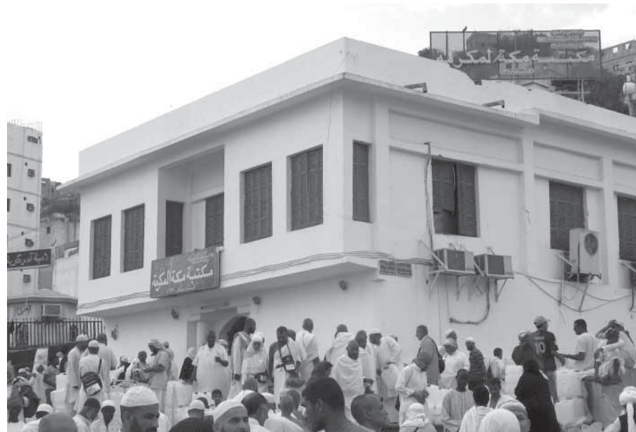
Маккалив Мухӱаммад Идавсил ﷻ къатта бивкӱсса кӱанай бувсса библиотека

Цаманал къатлувун уххан ччисса чӱмал чара бакъа ихтияр ласун аьркинссар. Ца чӱмал Идавсил ﷻ шава щяивкӱсса чӱмал ганачӱан ца адиминал увкӱн цӱувххуссар: «Бучӱирив уххан?» – куну. Идавсил ﷻ цала кьулугъчинахъ увкуссар: