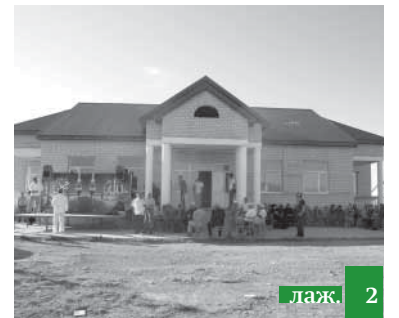
Шяъбан зурун хас бувсса мажлис