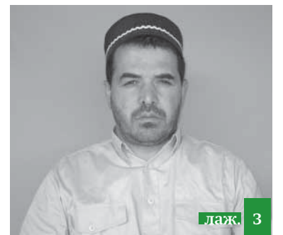
ОьрчIру тарбия бавриха къулагъас хъуннасар