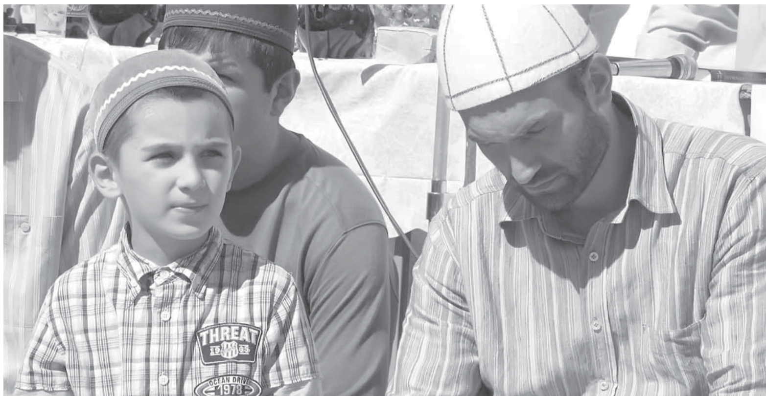
ИхІсандаул Иман ва Ислам камил дайссар

Оьмар-асхаб ﷺ буслай ивкІссар: «Жу буссияв Русулуллагънашал ﷺ щябивкІун. Му чІумал жучІан увххуна цан инсан, хъинну ххуйсса яннар-давухсса ва ккаккан ххуйсса лажин дусса. Жуватусса щинчІав га кІулсса акъая, амма ганай сапарданул асаргу чІалай бакъая. Га инсан Идавсил ﷺ хъхьичІ щяивкІуна, цала никру ганал никиртгайн шун дурну ва цалла кару Идавсил ﷺ ликкуртгай дирхъуну. Ганал увкуна: «Я МухІаммад, буси ттухъ Имандалия» - куну. Идавсил ﷺ увкуна: «Аллагънайн ﷺ Иман дишаву, малаиктурайн Иман дишаву, Лут-тирдайн Иман дишаву, Идавстурайн