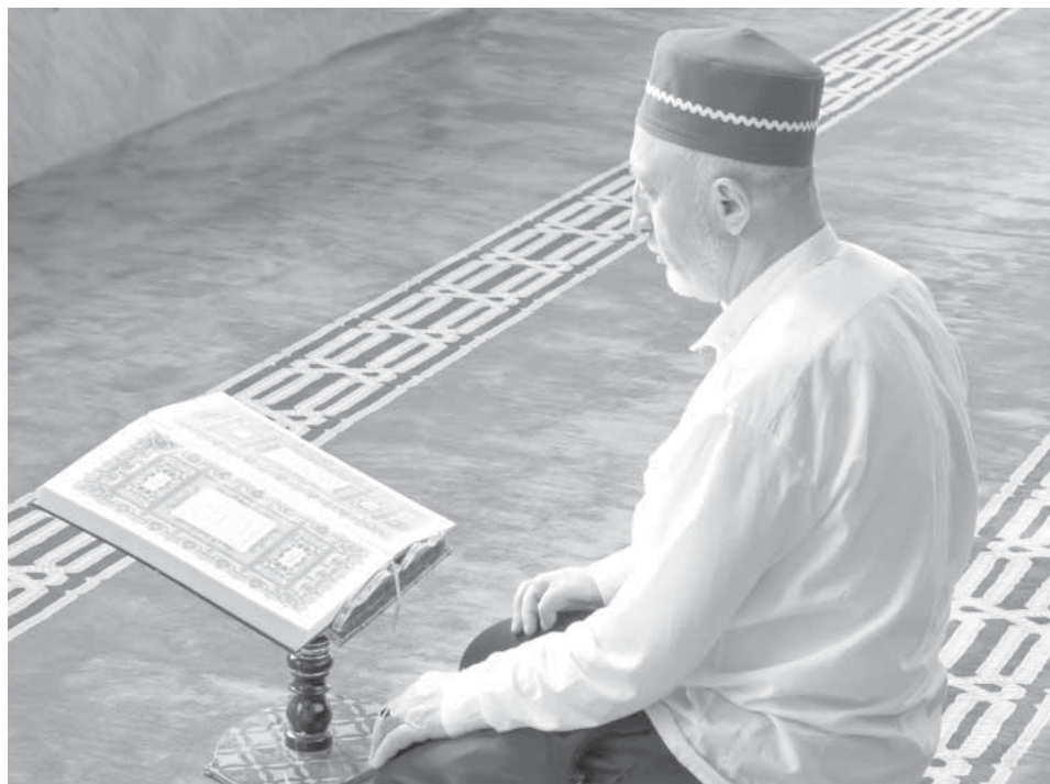
Кьурьбан буккаву – яруннигу, вичйалгу мазралгу эбадат.

бизан буну, Аллагь ﷻ дакйин утун, аькьуба дакйин дуртун кйура аян айссар. Ялагу шййтйан ялул ххьавхун, мунал дакйин вас-васру бунтун, ина аьхИмакьсарав, чурххан ччимур цан къабара, винна ччимур цан къадукара, ччимур цан къахйачара, чурх заев цан буллайра, дуняллул неьмат цан къаласара, шил дукан къаританна, пуланнал канай ур, пулан хйачйлай ур, пулансса аьлимчувналгума буллай ур, къабучйину бивкйссания, муналгу къабанссия, оьрму лахъиссар, тавба данхьуви, кйура аянхьува тйий, ялагу буллан гьуз учин айссар. Ялагу мунал дакйивун малаик увхун дакйин бутайссар, ина дуняллул чансса лазатиртгах абадлийсса алжаннул неьмат къюкьиннав, халкь бйайкьуннича куну, инавагу