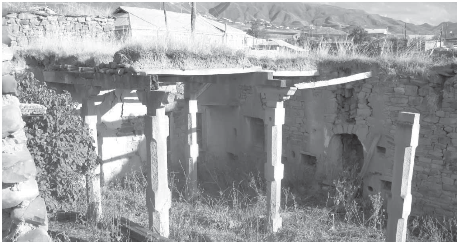
Бухмур мизитрал эялу

Ихтилат бувссар Сайфуллагъ МухIаммадаьлиевлул