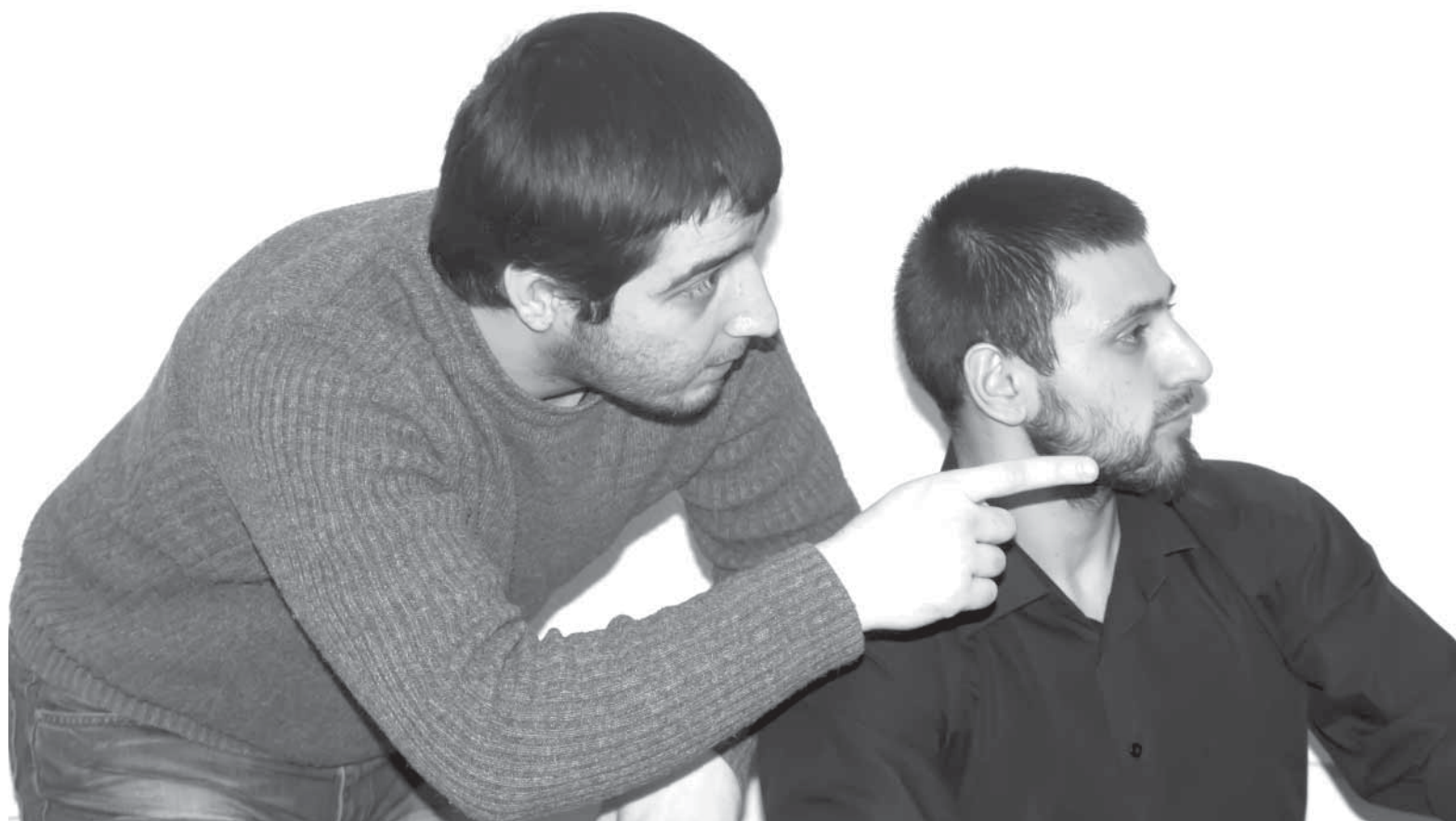
Цайминнал бунагъру загъир баву – хъунмасса бунагъри.

ХАЛКЪУННАЛ БУНАГЪРУ КІУЧИ БУВАРА, АЛЛАГЪНАЛ ﷺ ЗУЛ БУНАГЪРУГУ КІУЧИ БАНТИИССАР