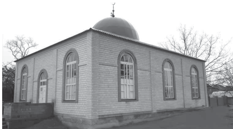
Кизилортлул райондалийсса Хъанардал шяравусса мизит.

– яру мазрасса лу. Ттунма яру маз кьабувчIайхха куну, лавгун махъунмай бишав. Ялагу пикри хъунни, буккин кьахъурчагу, барачатран ттучIава шаппа бикIанссарча тIисса. КIура авну лавгун, ласав га лу махъунмай. Гива увккун нанисса чIумал на дуаь дурссия, Я Аллагь! Ва луттиравусса мавлуду дуклан ттухъхъун тавфикь була, куну. Мунир махъ 2005-ку шинал автобусрай ХIажлив наниний на га лу ттушала лавсэссия. Гайминнал мавлуд ккалаккисса чIумал на га лугу тIивтIуну хха бувгуну, гайннал хъи-рив тикрал буллан икIайссияв. Мукун,