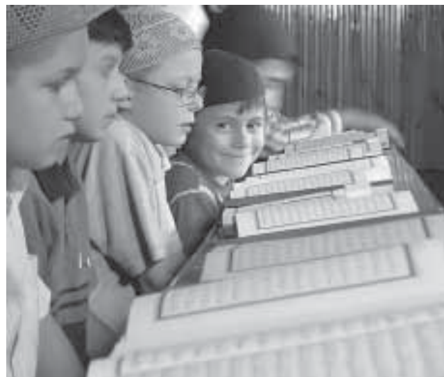
www.islamdag.ru деген сайтдан алынган