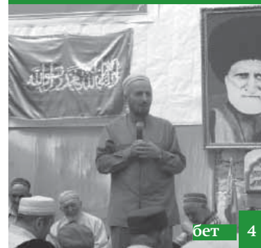
Жамиятланы бирикдирме герек!