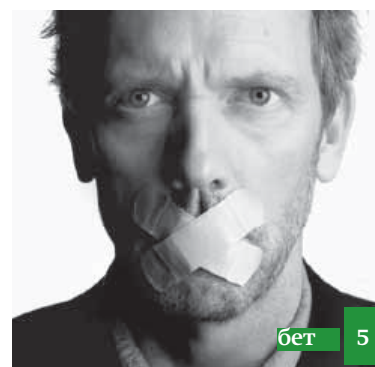
Авамгъа берилеген жавап иннемей турувдур