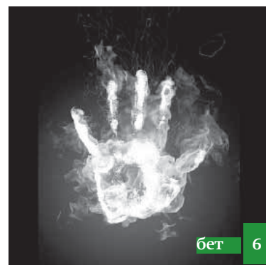
Къудратны Еси булан налатлангъан