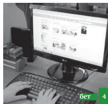
Салам, ишлер нечикдир?