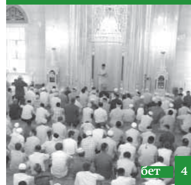
Исламгъа чакъырыв ва къаныгъывлукъ