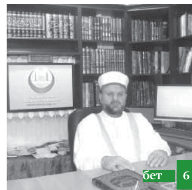
Волжскийни сириялы имамы