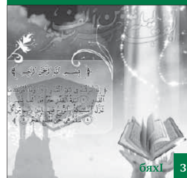
Лайлатуль къадри - ряхлмула дуги