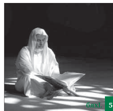
Аллагъла валибачи инкарбиубтас зарулти