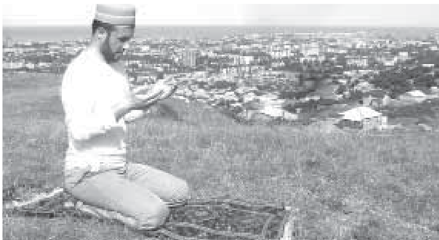
Рамазан базлис гѣргъи дубуци – Рамазан базлизир дубуцибти Аллагъли ﷻ къабулдирнила лишан саби.

Дубуци – ил рухѣлашал адам думувѣгни саби, ил багъандан Рамазан баз – рухѣлашал умувирни-ла баз саби. Рамазан базлис гѣргъи Шавваль баз лѣбкъуси саби, сунезибра Аллагъличи гъамиес багъандан бусурмайс гѣяхѣси имкан лѣбси. Илгъуна имкан саби 6 бархѣ дубуци. Ил имкан Чевяхѣсили ﷻ чебаахъбси саби. Камси кѣяйгѣилис Аллагъли халати шабагъатуни чѣйсули сай – ил ахирагарси малхѣмдеш саби ва Сунечи Сунела лугъри гъамбиахъес чеимѣла имкан саби. Пѣбадатбирес кабизахъурси замана лѣбси ахѣн, илгъуна барес лерилтра гѣямрулизив бусурман кѣяйгѣилизив виѣс гѣягънибиркур. Рамазан базлизибун дубурцуги адамтачила ца гѣялимлизи хъарбаили саби: «Беглара вайги адамти саби – Рамазан базличибун Аллагъличила гъанбиркахъути, бунагъагати саби лерилтра дусмазиб Аллагъла гъуйчи кабизурги». Рамазан базлис гѣргъи дубуци – Рамазан базлизир дубуцибти Аллагъли ﷻ къабулдирнила лишан саби. Аллагъли ﷻ гѣяхѣси баркъуди къабулбирухѣли сунела лагълис чеимѣякъ имканти лугули сари