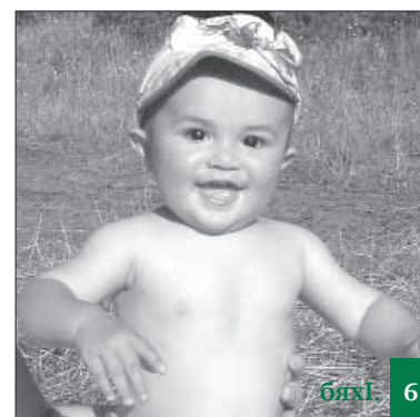
Бусурмантани сен сунна гІелайзи арбихуси?