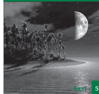
Иш дунъяла нигІматуназибси нигІмат