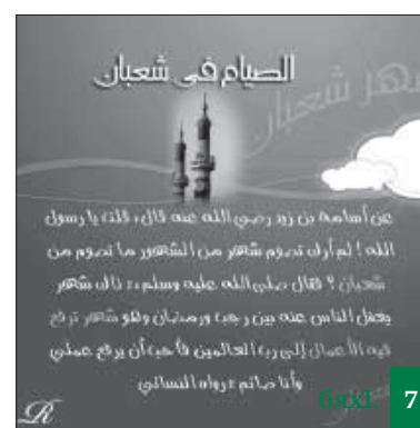
ШагІбан базла дурхъадешлуми