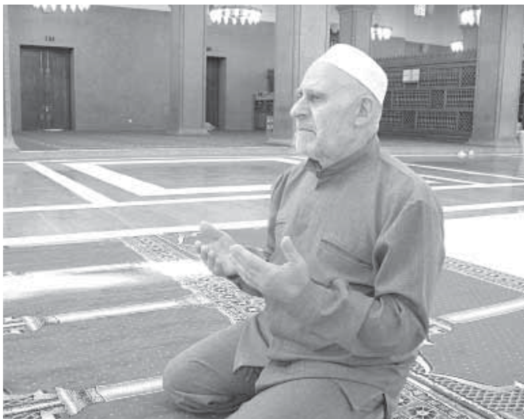
«Гъарли-марли, хІушазивад бегІлара гІяхІси Аллагълизивад уружІан сай»

Хатам веХІхъиб илдачила бурес: 1. Адамтаци хІерикІули, нуни хІясиббарира гъарилла сунес дигуси юлдаш адам левни. БебкІайчи илди илкъяйда гъалмагъбикили кавлули саби. БебкІили гІергъи илдала юлдашдешра тамандирули сари. Нуни биалли къасбарира иш дунъяличивра, ахиратлизивра даим набчил барх калеси, вебкІибхІели хІяблavra вархъХІетеси, юлдаш варгес. ХІера, дила юлдашуну сарлин нуни чердикІира, хІяблavra ну гІевуцести, гІяхІти баркъудлуми. ХІядислира ил марби-рули саби: « ВебкІибхІели хІяблavra хІела юлдашунули дирар хІела баркъудлуми ». 2. Адамтаци хІерикІули, нуни чебаира, сегъунсилра къимат агарси дунъяла лебдеш бучес гъазализибти. Ил бучниличи, раз-