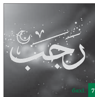
ХІяббузри ❁ 7