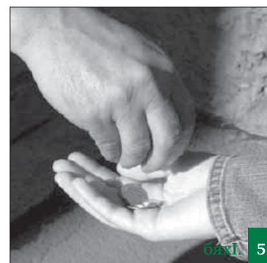
Садакъала къадриличила ❁ 5