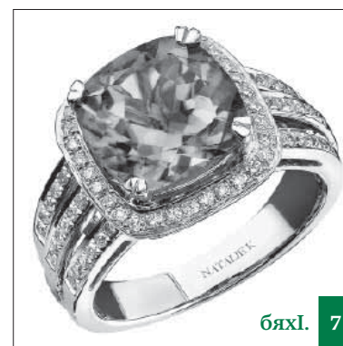
Тулєка бихни суннатбиъниличила