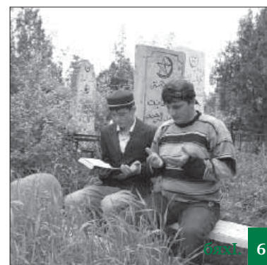
Бикъули вара бебкйибтас?