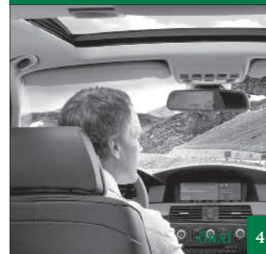
Машина биканни се багъес гйагънили?