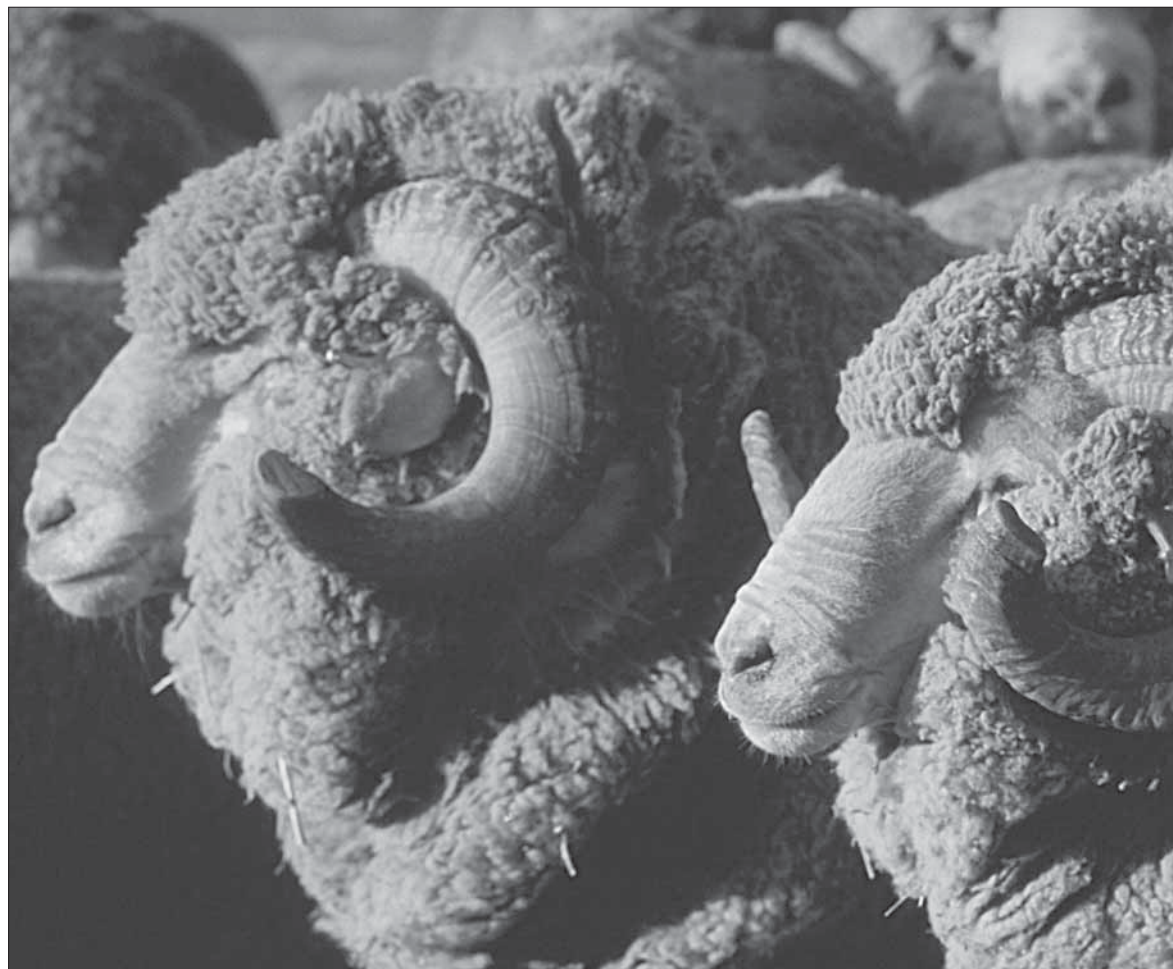
Гъурбан апѳуз гъубккубдин ифдин гъарсаб литѳан жилина дабхъайиз улихъна Аллагъди ﷻ къабул апѳуру

дугъан къяляхъ гъахъидари ва имамари гъисаб апѳурайиганси, накъвдихъ Къур'ан урхувал рягъматдиз душнайириз хайирлу ляхин ву, иллагъки машквран йигъари, гъаз гъапиш му рягъматдиз душнайириз аргухъди гъюрмат апѳурайивалик гъисаб ву, ва гъийихдарин рюгъяр шад шулу. Имам Гъазалийин «Диндин гъякънаан илмар ачмиш хъувал» кѳуру китабдиъ гъамѳи дупна: «Гъийихдар, читинвалигъ айиган, кюмек бадали фитхъанвуш хъчѳихуз ккунди айи инсанарик гъисаб ву». Эгер чѳиви инсанари дурарихъанди Къур'ан урхуруш, дюаъ апѳуруш, садакъа тувруш, думуган гъийихдарин рюгъяр аргухъди шад шулу, дюн'яйиъ айи вари шей'ар тувубѳан аргухъра кади. Ухъу дурариз фукъан ужувлар гъапѳишра, малаикари гъамѳцдар гафар кѳури, аку дюн'яйиан гъадму ужувлан хабрар хуру: «Гъаму