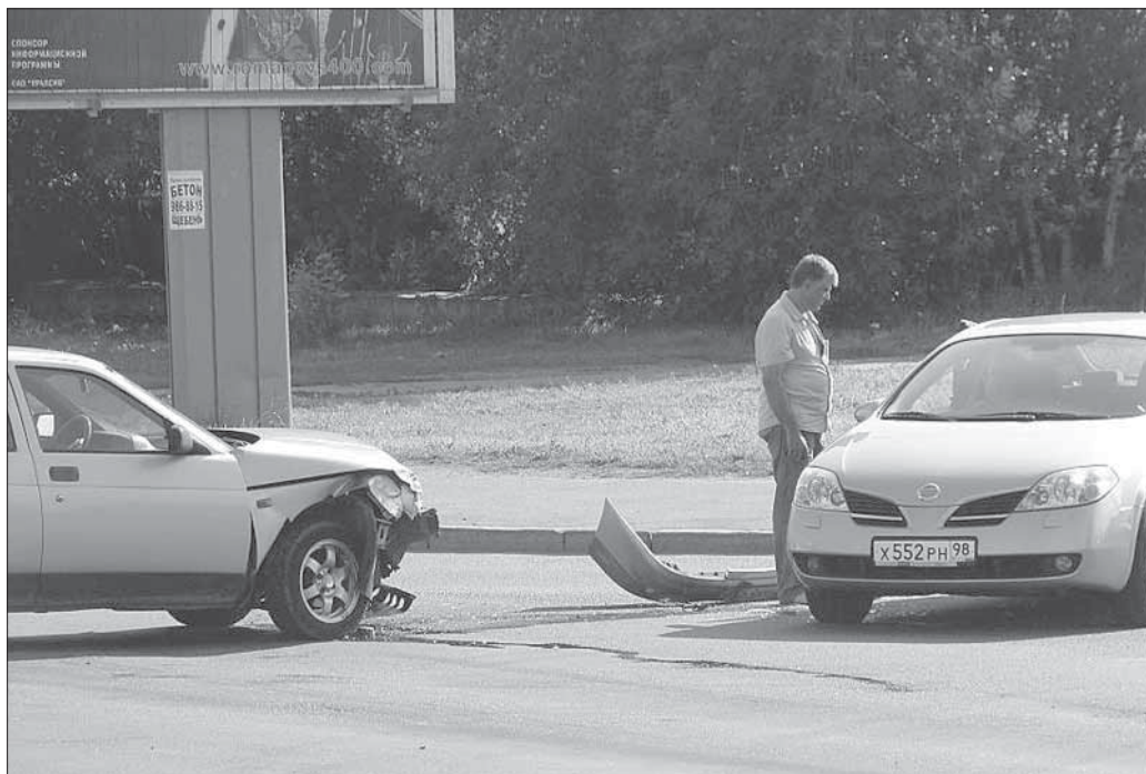
Гъарсар шаф'ериз чан жавабдарвал адрувалиан, чаз рякъярин къанунар аъгъдурвалиан аварийи хъуз мумкин вуйиваликан ва думу ляхникъан чав му дюн'айиъгъра, Аъхиратдиъгъра жаваб тувну ккуниваликан аъгъяди ккунду.

Ихъ арайиъ гизаф къайда-низам ч'ур ап'ру шаф'ерар а, ва, дурар сеbeb духъну, гизаф дишагълийирил жилар хътарди гъуз-ра, веледар етимар шула. Къур'андиъ дупна (мяна): «Ув'ина гъюру вари къаза-бала яв увхъан ву» (сура ан-Нисаъ, 79 аят). Жара аятдиъ дупна (мяна): «Учв'ина гъюру фунуб вушра къаза-бала, учву ап'ру ляхнарилан айиб ву». Гъаму аятариан гъаври шулуки, эгер ухъу гъякълуди гъузиш, Аллагъу Тааблайи ухъу къаза-балирихъан уърхиди. Хъа эгер Аллагъу Тааблайи, ухъхъан имтигъан бисуз к'ури, саб къаза-бала тувиш, думу ухъуз Аъхиратдиъ рягъмат хъибди. Гъамус шаф'ери фу ляхнар тамам дап'ну ккундуш, гъаддикан улхидихъа. Эгер гъарсар шаф'ери Аллагъдин ﷻ амриинди гъаму исихъ улупнайи ляхнар тамам ап'ури гъахъиш, думу касдихъан Аллагъди ﷻ къаза-балир ярхла ап'иди, инша-