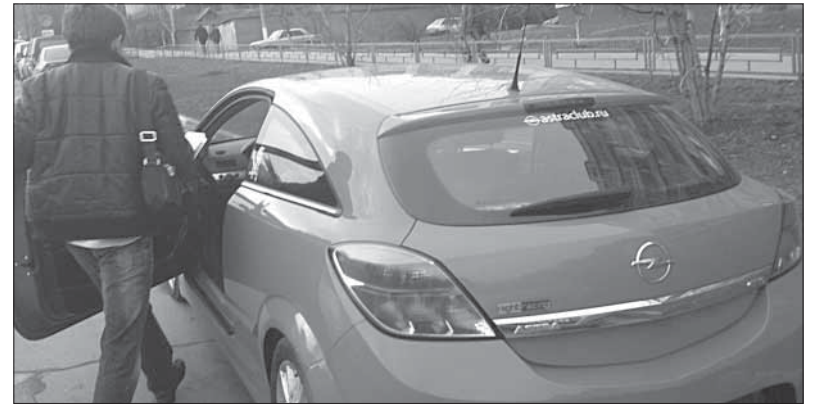
Машиндиъ, автобусдиъ, ясана жара транспортдиъ, эьруган, арччул ликриинди учIвуб ужу ву. Вари ужудар ляхнар Пайгьамбари ☞ арччул терефнаан ккергьри гьахьну.

Ярхи рякьюз гьягьюз ккайири гьаму дюаъра урхуб ужу ву: « Аллагьумма инни асьалука фи сафари гьаза аль-бирра ва-ттакьва ва миналь-аьмали ма тарза. Аллагьумма гьавин аьлайна сафарана ватIви ланаль-бутгьда. Аллагьумма анта ссагьибу фи сафари валь халифату филь агьли,