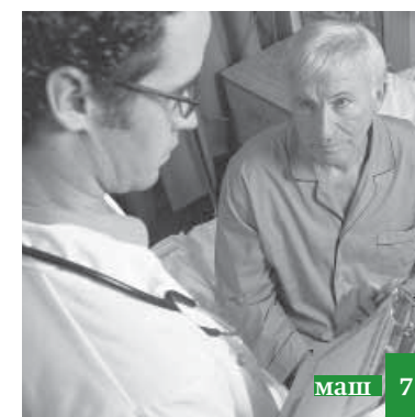
Жилириз хъайивал ап'узди хпири пул ча гъапну!