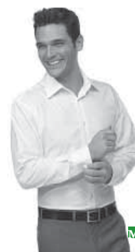
Палат алабхъуз аьгъяди ккунду