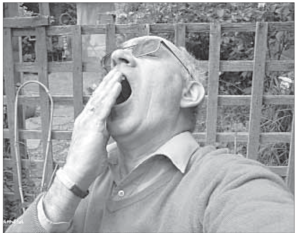
Учкван шликла гъагъ апури гъахъиш, дугъу чан ушв хил иливбинди элебкри, дарш ушвниъ шейтлан убчъвуз мумкинвал а

Эгер инчи гъапу касди «Альгъямдуллилагъ!» гъапуру, дугъаз «Яргъамукалла!» дупну ккундар. Амма инчи гъапури «Альгъямдуллилагъ!» пуз к'ваин дапну ккунду, ва дугъу гъаци гъапиган, дугъаз жаваб вуди «Яргъаму-