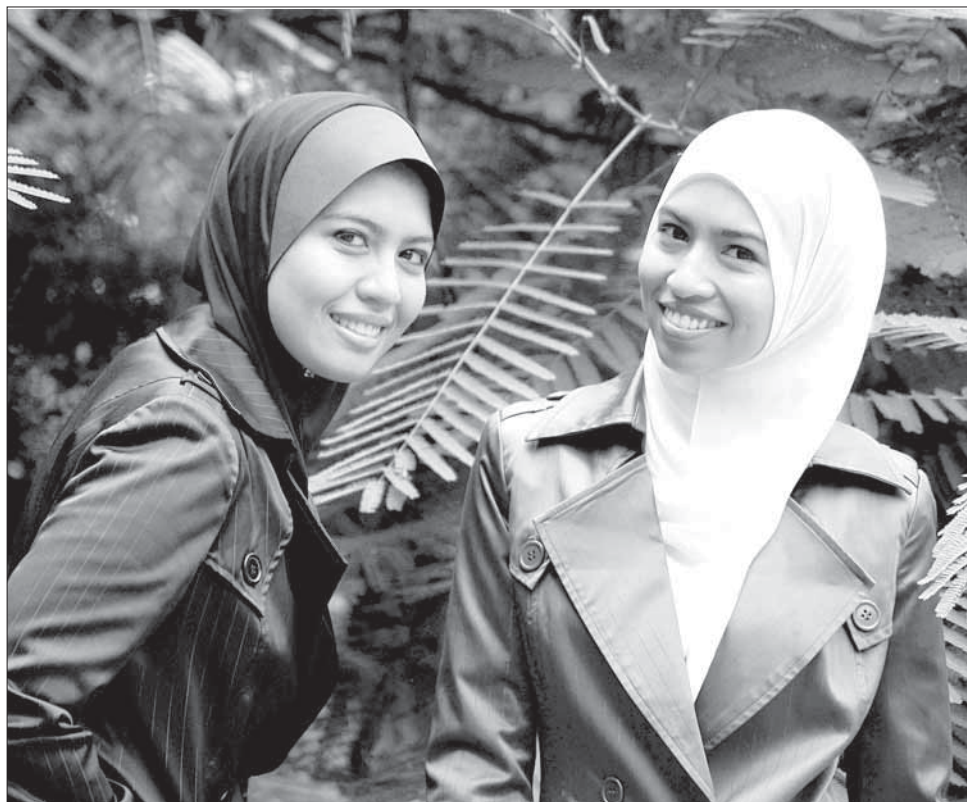
Эгер учуз читинди вуш, шлиз-вуш ичв дерднакан ктибтуз ккундуш, ичв жилариз кидибтай, иллагъки гъадму касди учуз ужуб тербия тувур

Хъа амма дурариз хабар адар гъарквандин вахт, жинар артухъ шлу вахт вуйиваликан; - Гъарган балахонар алахъуз гъитру. Фуж лигурахъа узухъинди? Узу шлиз герек ву? Уткан, жандин алабсру ккуртг алабхъну клури, фукла даршул аьхир. Гъацдар дюшюшара шулу, жилир хулаъ адруган алахъну алабсру палат, кадатну машарикан химикатар, идитну атнар, удучъвру гъяатдиз. Хъа Аллагъдиз ﷻ рябкъюрайивал бала-