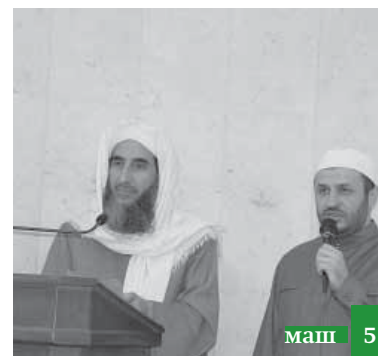
Иракъдиан вуйи хялижв