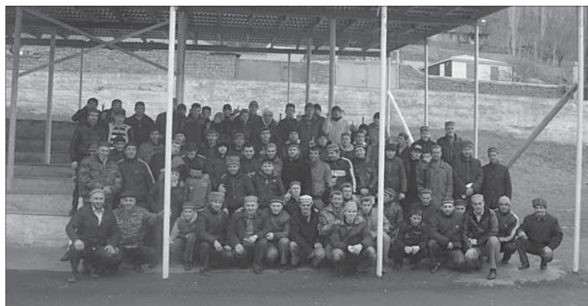
Гьит Аллагьди ﷻ мицдар мажлисар артухъ апрури, иллагьки Дагъустандин кафари терефнаб.

Кафари Дагъустандиъ мицдар серенжемар цибтлан шулдар, гьаци вуйиган Рутулиъ гьабхъи серенжемдиз гизаф инсанар уч гьахънийи. Мицдар серенжемар илим аьгью апруз, ужуб рякьюхъна дих апруз сеbeb шулу. Алимарин улхбарин уч духънайидари гизаф чпиз аьгьдруб гьудубгьну.