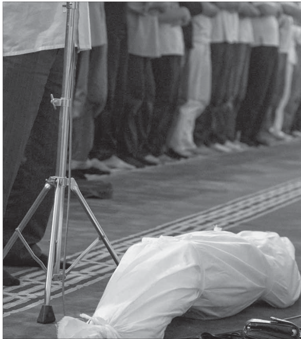
Аьхиратдикан гьарган кьваинди гьибтай.

рюгназ саламар хьгауру ва гьерхру: «Шлинуб ву му рюгь? Фукьан уткануб ву му рюгь!». Ва жаваб тувру: «Му рюгь гьудгнар гьаплу, ушвар гьидису, садакьйир туву - дюн'яйин гьаму вари читинвалар Аллагь ﷻ бадали кьулиз адагьу касдинуб ву». Аллагьди ﷻ думу