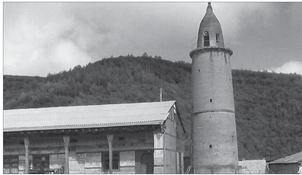
Мистаз марци курттар алахьну гьарахай.

Сар аьрабли Пайгьамбарихьан ❀ шубуб ражари гьерхру: «Аьмаларикан фунуб уьуб ву?» Шубриб ражари Пайгьамбари ❀: «Илим аьгью ап'уб», - к'ури, жаваб туву. «Узу аьмал ап'уваликан гьерхрара», - к'ури гьапиган аьрабли, Пайгьамбари ❀ гьапну: «Илим аьгью дарап'ди, аьмал къа-