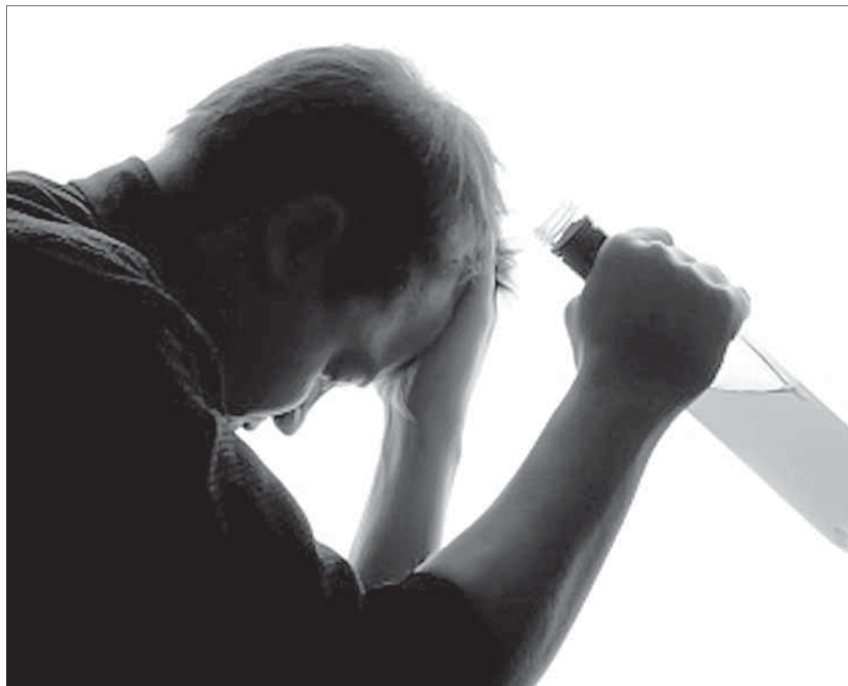
Эй Аллагъдихъ ﷻ хъугъдар, дугъриданна, ички, азарт тамшйир, хачар (идолар) – мурар шейтнин ляхнарникан ву, учву дурарихъан ярхла йихъай, белки учву шадлу, бахтлу шалчва.

гъубхъну. Чяхир гъубхъган, «клубан» духъну, дугъу думу дишагълийихъди зинара аплуру. Зина аплурайи вахтна, дина думу дишагълийин жилир гъюру, ва дурарин къюриддин арайиъ кчлхъбар шулу, ва душваъ Барсисди думу кас йикфуру. Инсанари Барсис гъидиснийи ва гъакимдихъна гъурхнийи. Гъакимди дугъаз 80 гъирмаж чяхир убхъбан, 100 гъирмаж зина аплбан йивуз гъитну, ва хъасин ккерхнийи. Думу ккерхнайи вахтна иблисди гъаплнийи: «Увуз ккундуш, узу увуз кюмек аплурза». «Эгер уву увуз кюмек гъапиш, увуз ккуниб фу-вушра тувурзавуз», - гъаплнийи Барсисди. «Узуз икрам аплин», - гъапи иблисди. «Ккерхнади фици икрам аплуру?» - гъапи Барсисди. «Кфулихъди икрам аплин», - гъапи иблисди. Барсисди иблисди кфулихъди икрам гъаплнийи - ва гъамци думу куфригъра ахънийи. («Дуррату насигъин» китабдиан).