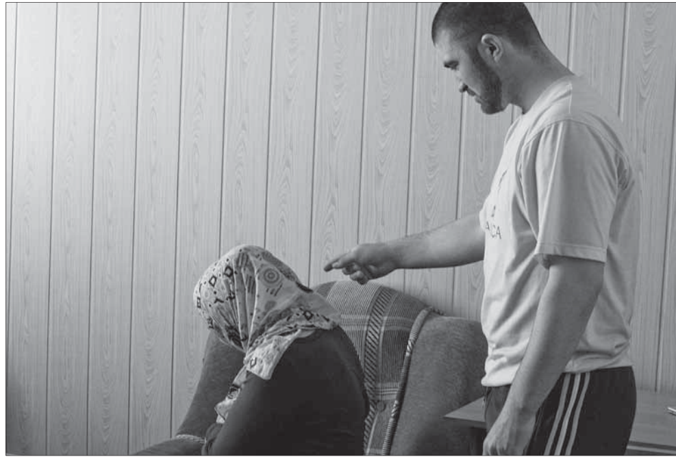
Гьядисдиъ дупна: «Ихтияр айи ляхнариккан Аллагъдиз ﷺ варитан даккниб тлалакъ тувувал ву»

Сад йигъан Пайгъамбарихъна ﷺ сар дишагъли гъафнийи ва гъапнийи: «Я Аллагъди ﷻ Гъаьнайир, швуваз гъягъруган узу жигилди, утканди, девлетлуди вуйза. Амма йисар гъягъюри, йиз утканвал циб гъабхъну, багахълуйир ярхла гъахъну, девлет имдар, ва, гъаму ляхнар себеб вуди, йиз жилири узуз тлалакъ тувну. Дугъкан узуз веледар