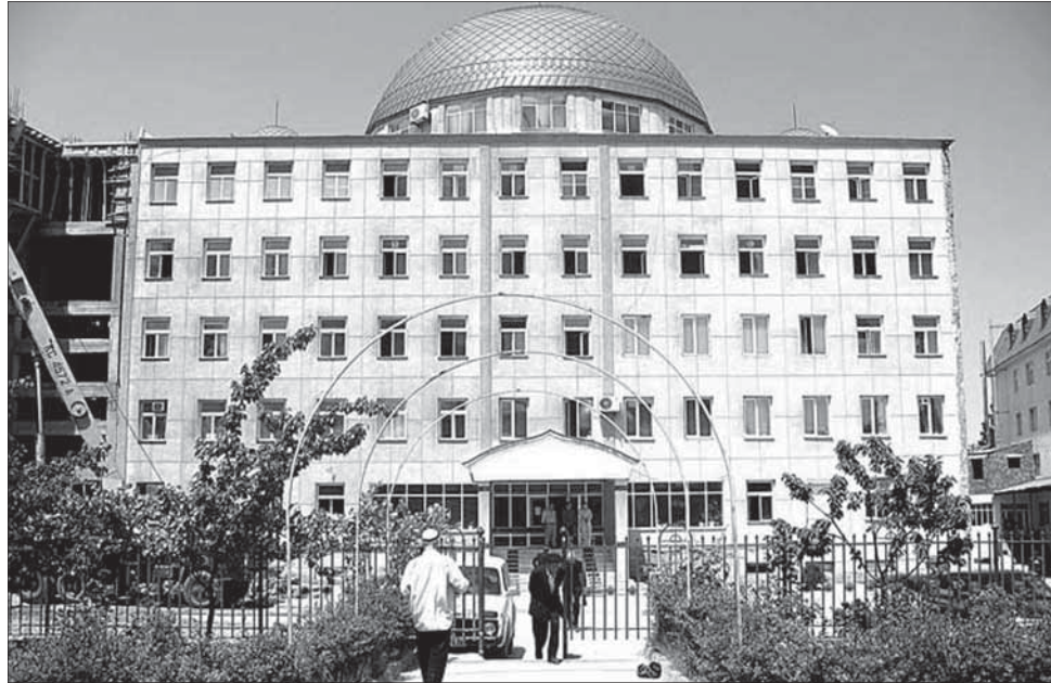
Дагъустандин Исламдин Университет (ДИУ).

ДИУ-дик экечIдалди заз Исламдикай чирвилер авачир, Къиблепатан Дагъустанда яшамиш жезвай диде-бубайри чпин аялриз диндин илим гузвач къван. Шукур хъуй Аллагъ-Тааладиз, алай вахтунда Дагъустанда гъафалимар ава ва абурувай илим къачудай мумкинвал ганва Аллагъди ﷺ. Диндин илим дуъньядинни эхиратдин девлет