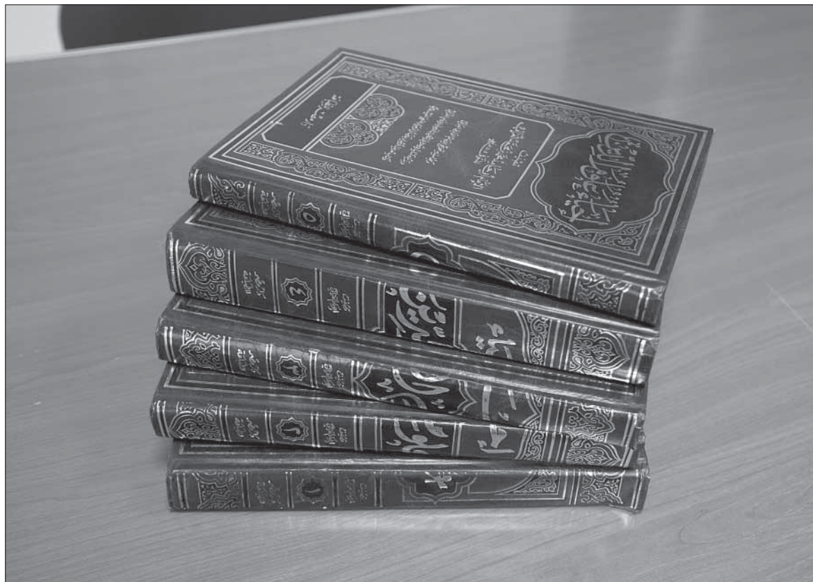
Имам аль-Гъазалиди къхенвай «Игъйа улум-уд-дин» («Диндин чирвилерал чан хкун») ктаб.

гъакъиндай араб чIалан грамматикадин къейдерал асаслу хъайитIа, чаз ихътин мана жагъида. Аллагъди ﷻ Вичи Къуръанда ракъиналди, рагъ экъечIай вахтуналди ва мичIи йифелди къин къунва. И аятра инсан имансузвилехъ гъидай затI авани?