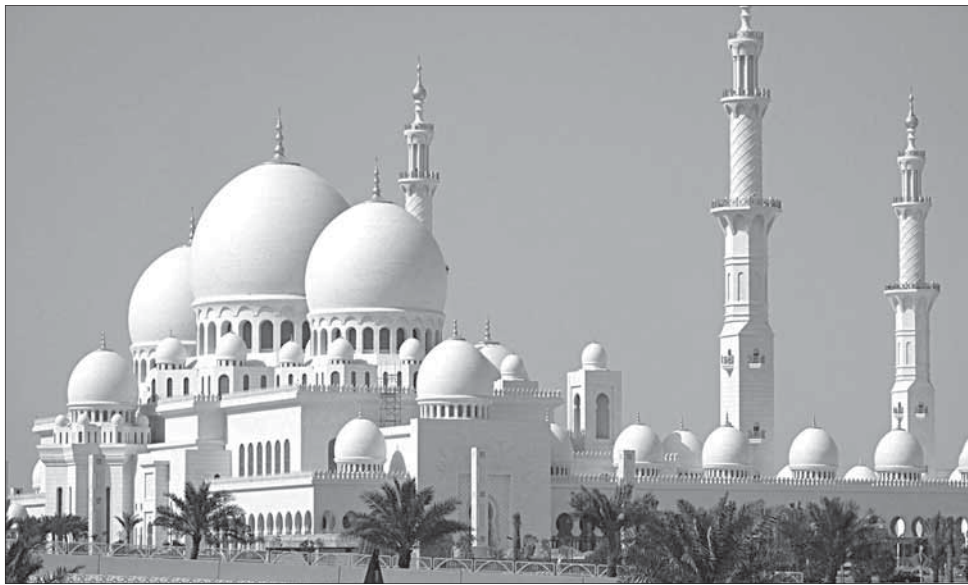
Мискинрин минараярни бид'а я.