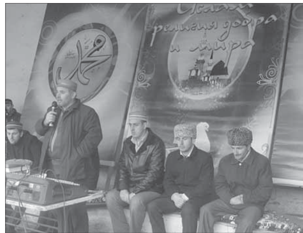
тин, халкъдин арада садвал твазвай, гъурмет, хатур артухарзвай, берекатлу межлисар тешкилдай мумкинвал гурай! Амин.

Къуй гъар са хуьруьн администрациядиз ихъ-