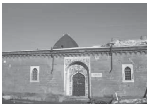
Гъумуксса Хъун мизит.

Къиямасса Къинилин иман дишарил мяъна тӱурча, му ина дакӱ дацӱан давури хӱакъну Аллагъу Тааьлалан халкъ бизан бантӱшиву, литӱун бивну махъ. Ми халкъ бацӱангу бантӱссар Къиямасса Къинилул арив, мизан-цинцилттугу дишинтӱссар оьсса ва хъинсса аьмаллу буцин, халкъунная хӱисаб-суалгу ласунтӱссар. Ми халкъуннава цавай-