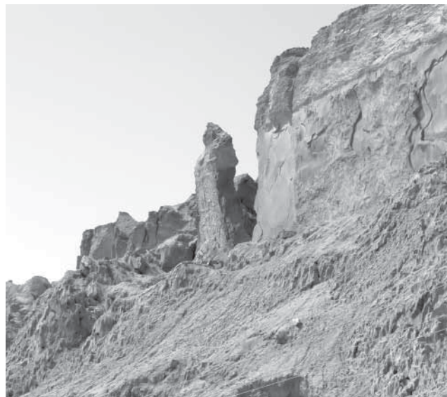
Садум зунттуийсса «Лутілул шарсса» тӱсса чару.

куну бур. Аллагъналгу ﷻ мунал дуаьлухъхъун жаваб дуллуну дурча, муначӱан мукъа малаик гъан увну ур жагъилсса, ххуйсса оьрчӱал суратирттай. Заннал ﷻ ми малаиктурайнгу буюр бивну бур мукъилва барашинна къадурну Лутілул ﷺ къавм гъалак мабари, куну. Яла кӱай малаиктал Лутілулчӱан ﷺ лавгун жу вил хъаммаллу, куну бур. Яла Луті гайгу бивцуну шавай лавгун ур. Гайннахъ куну бур: «Зун ва шярваллил хӱл къакӱллив?» – куну. Гайннал ци хӱалли? – куну бур. «Ва шярваллу дунияллийсса яла оьмур